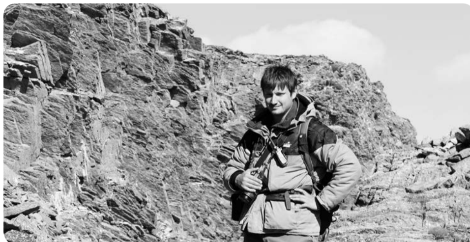
Каньон на реке Талата

ренции «Экологическое состояние Печорского региона – «ЭкоПечора-2012», удалось провести презентацию проекта по моделированию аварийных разливов на Морской ледостойкой стационарной платформе «Приразломная». Кроме того, сейчас проходит различные согласования организация заказчика на острове Колгуев. В ближайшем будущем хочется провести в Нарьян-Маре «Фестиваль Моржа» по аналогии с «Днём Тигра», который ежегодно отмечают во Владивостоке. Скорее всего, праздник пройдёт в ноябре и будет состоять из нескольких отдельных мероприятий: благотворительного концерта, совещания с представителями администрации, бизнеса и научного сообщества, тематических выставок и презентаций.