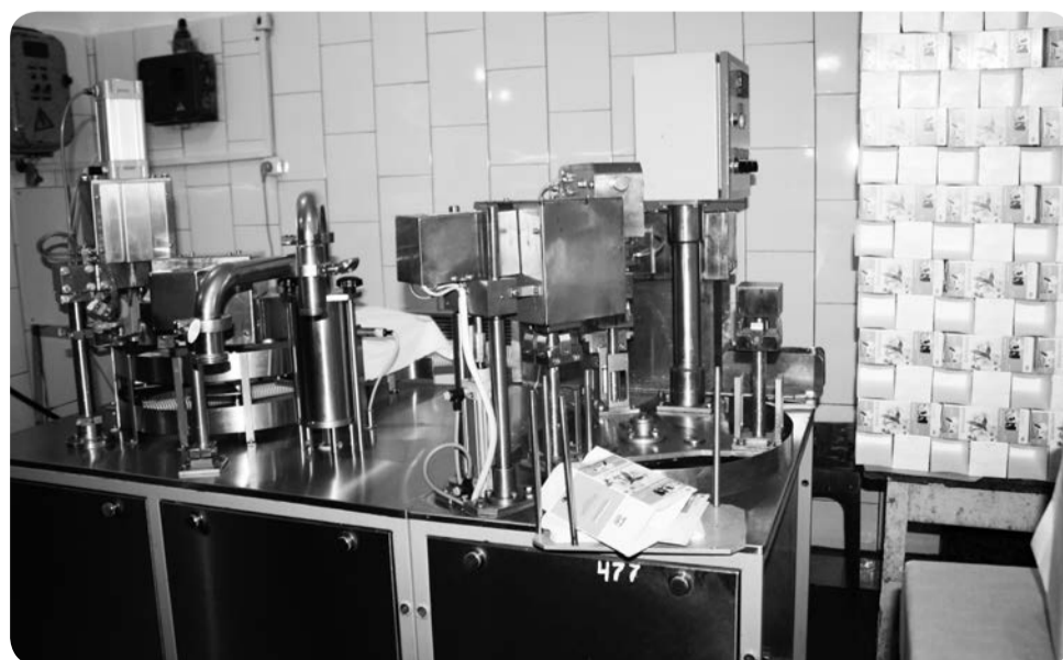
Установка по производству молочной продукции