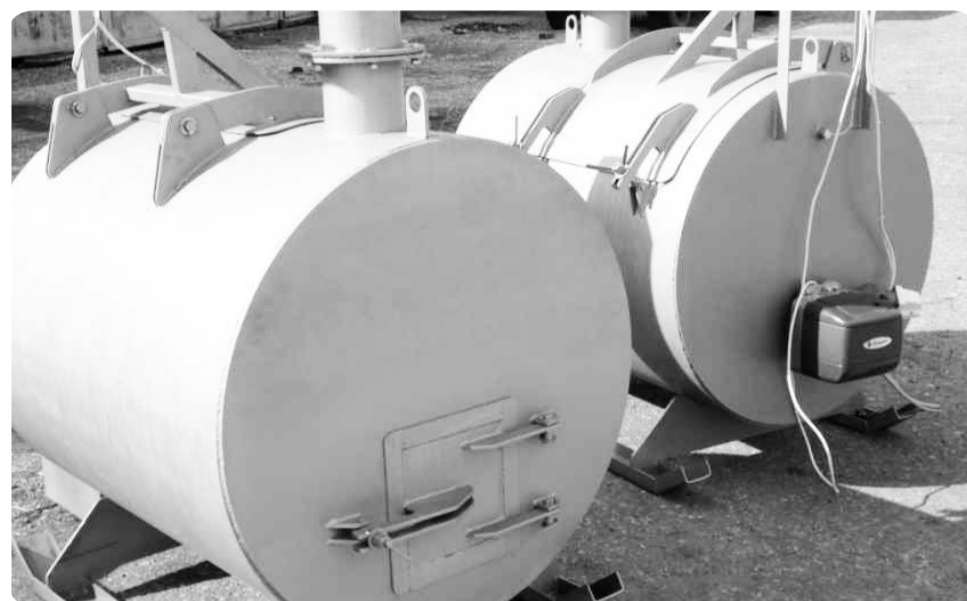
Крематоры для уничтожения отходов