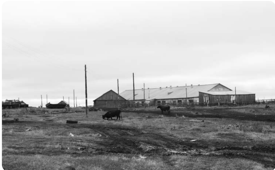
Ферма в Лабожском

Помимо участия в реализации долгосрочных целевых программ и оказания помощи предприятиям и СПК, отдел сельского хозяйства администрации Заполярного района вносит представления на поощрение работников СПК и МКП, принимает участие в подготовке крупных мероприятий с участием сельхозпроизводителей, в том числе Съезда Ассоциации «Ясавэй», участвует в заседаниях сельскохозяйственного совета при губернаторе НАО, на котором обсуждаются вопросы перспективного развития северного оленеводства, поддержки СПК.