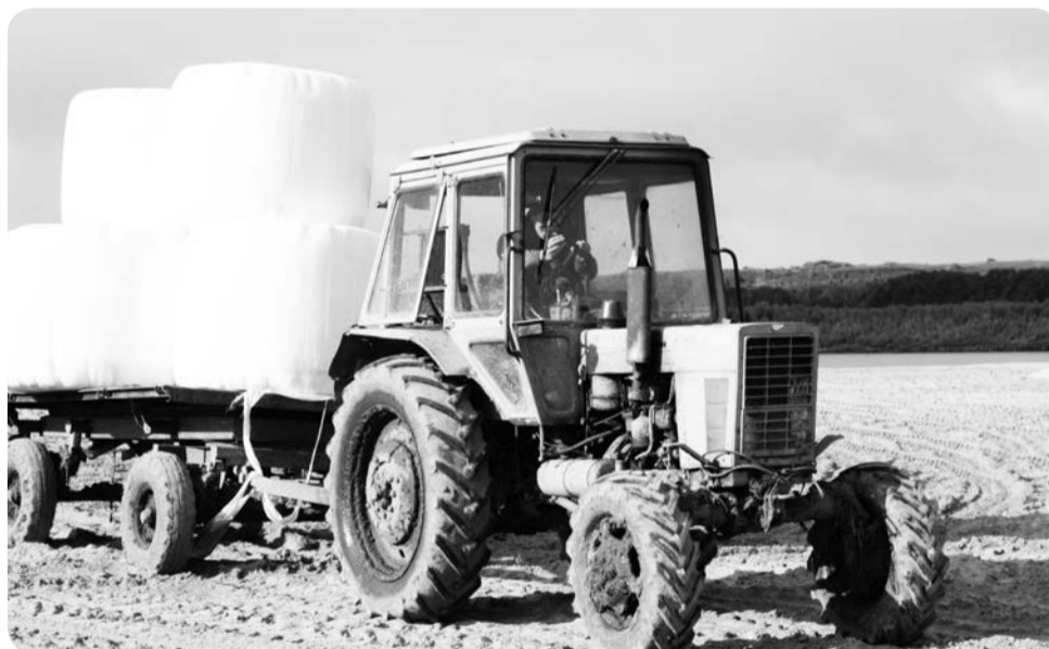
Новая техника на смену старой