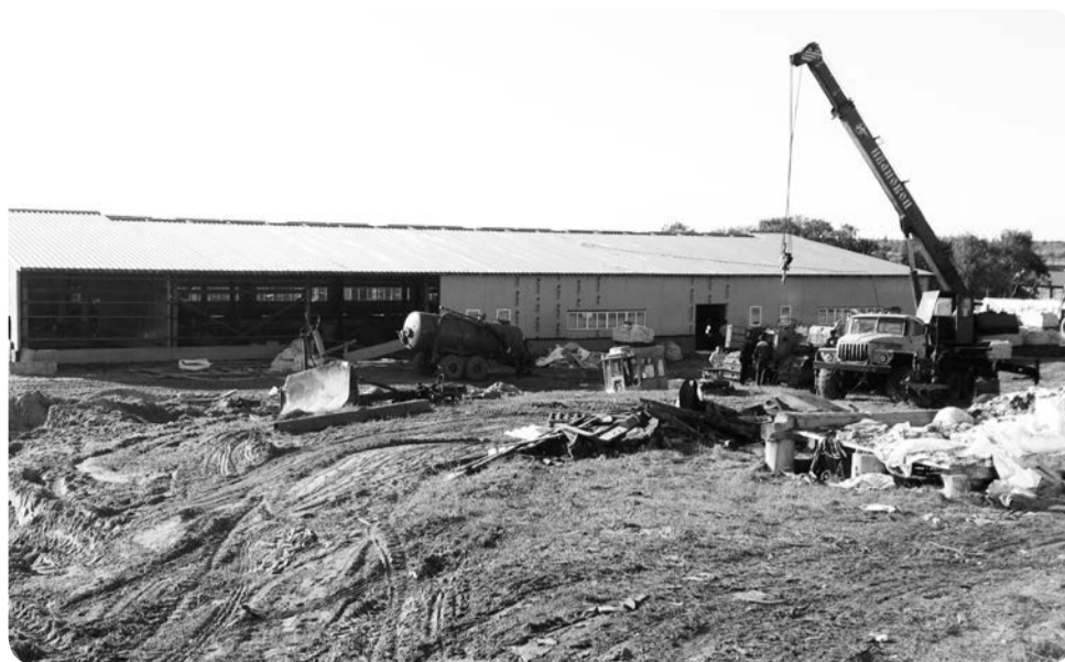
Строительство фермы в Оме

Отдел сельского хозяйства Администрации Заполярного района в рамках своей компетенции осуществляет решение вопросов местного значения, связанных с развитием агропромышленного комплекса Заполярного района. В основные задачи отдела входят: создание условий для устойчивого развития агропромышленного комплекса района; расширение рынка сельхозпродукции, сырья и продовольствия; модернизация сельскохозяйственной отрасли для повышения конкурентоспособности местной продукции; обеспечение качества производимых продовольственных товаров; создание условий для обеспечения жителей района высококачественной и разнообразной мясной, молочной, рыбной продукцией; обеспечение устойчивого развития сельских территорий, занятости сельского населения, повышения уровня его жизни.