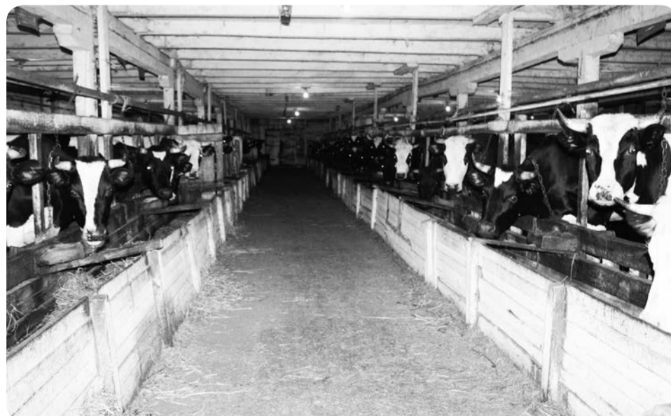
Ферма в Великовисочном